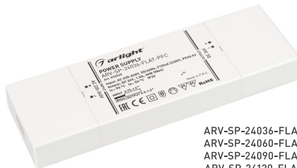
ARV-SP-24036-FLAT-PFC ARV-SP-24060-FLAT-PFC ARV-SP-24090-FLAT-PFC ARV-SP-24120-FLAT-PFC