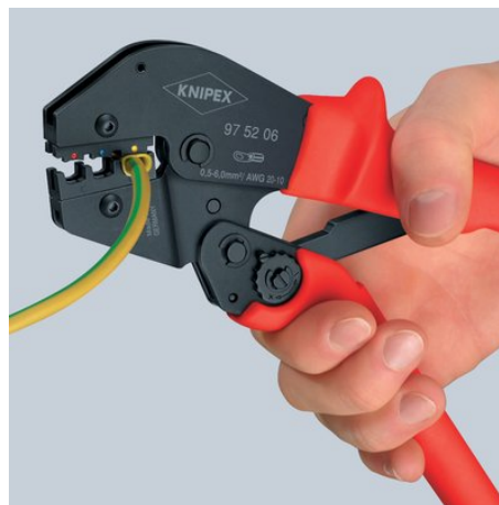
Второй этап: Теперь ручки сжимают для продолжения процесса опрессовки