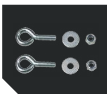
Комплект крепления на трос

Возможно изготовление светильника со встроенным датчиком движения.