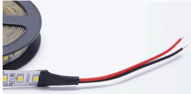
Новая комплектация: провода для подключения к блоку питания

Компания Feron заботится о покупателях светодиодной ленты 12V и упрощает способ монтажа. Теперь ленты LS603 поставляются с проводами для прямого подключения ленты к блоку питания (коннектор «мама» не входит в комплект поставки).