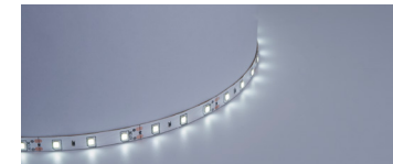
НОВИНКА Арт. 27744, 27603