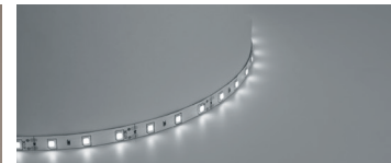
НОВИНКА Арт. 41446