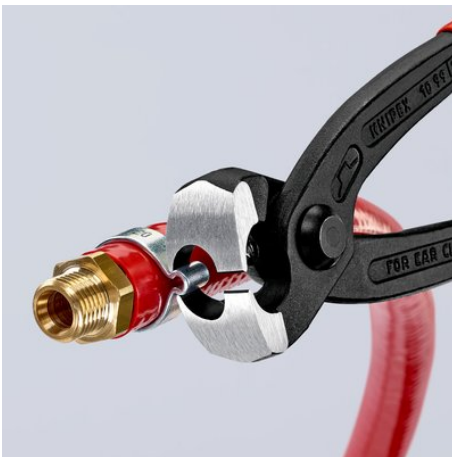
Герметичное крепление хомутом гибкого шланга на штуцере с помощью бокового носика для запрессовки