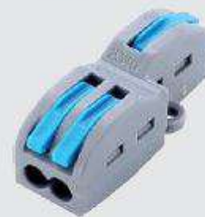
FD-12T (с выступом)

Типовые размеры: 20,5 × 13 × 14,5 мм (длина × ширина × высота)