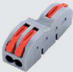
FD-12A (с пазом)

Типовые размеры: 20,5 × 13 × 14,5 мм (длина × ширина × высота)