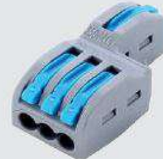
FD-13T (с выступом)

Типовые размеры: 39 × 17,5 × 14,5 мм (длина × ширина × высота)