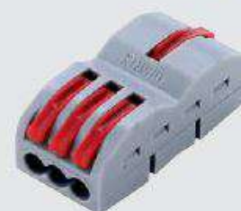
FD-13 (с возможностью соединения)

Типовые размеры: 39 × 18 × 14,5 мм (длина × ширина × высота)