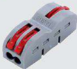
FD-12 (с возможностью соединения)

Типовые размеры: 39 × 13 × 14,5 мм (длина × ширина × высота)