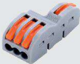
FD-13A (с пазом)

Типовые размеры: 17,5 × 20,5 × 14,5 мм (длина × ширина × высота)