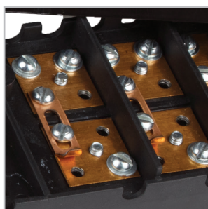
Материал контактной группы - латунированная сталь.