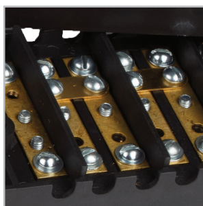
Материал контактной группы - латунь.