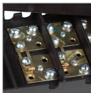
Материал контактной группы- сталь.