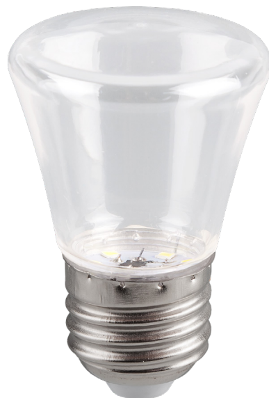
Арт. 25908, 25909