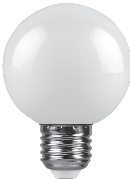
Арт. 25902, 25903